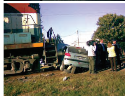
Los accidentes y los embotellamientos sobre el paso a nivel son una constante. Habrá que ver si los cambios de la municipalidad ayudarán a frenarlos.