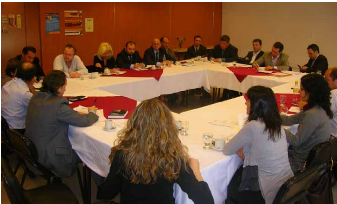
▲ Miembros de Nuestra Córdoba junto a especialistas se reúnen con concejales de todos los bloques políticos.

Vamos de Colombia, la Red Ciudadana Nuestra Córdoba decidió promover la sanción de la ordenanza de plan de metas de gobierno.