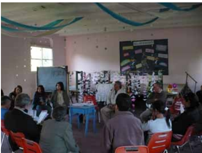
▲ Encuentro con centros vecinales de la ciudad.