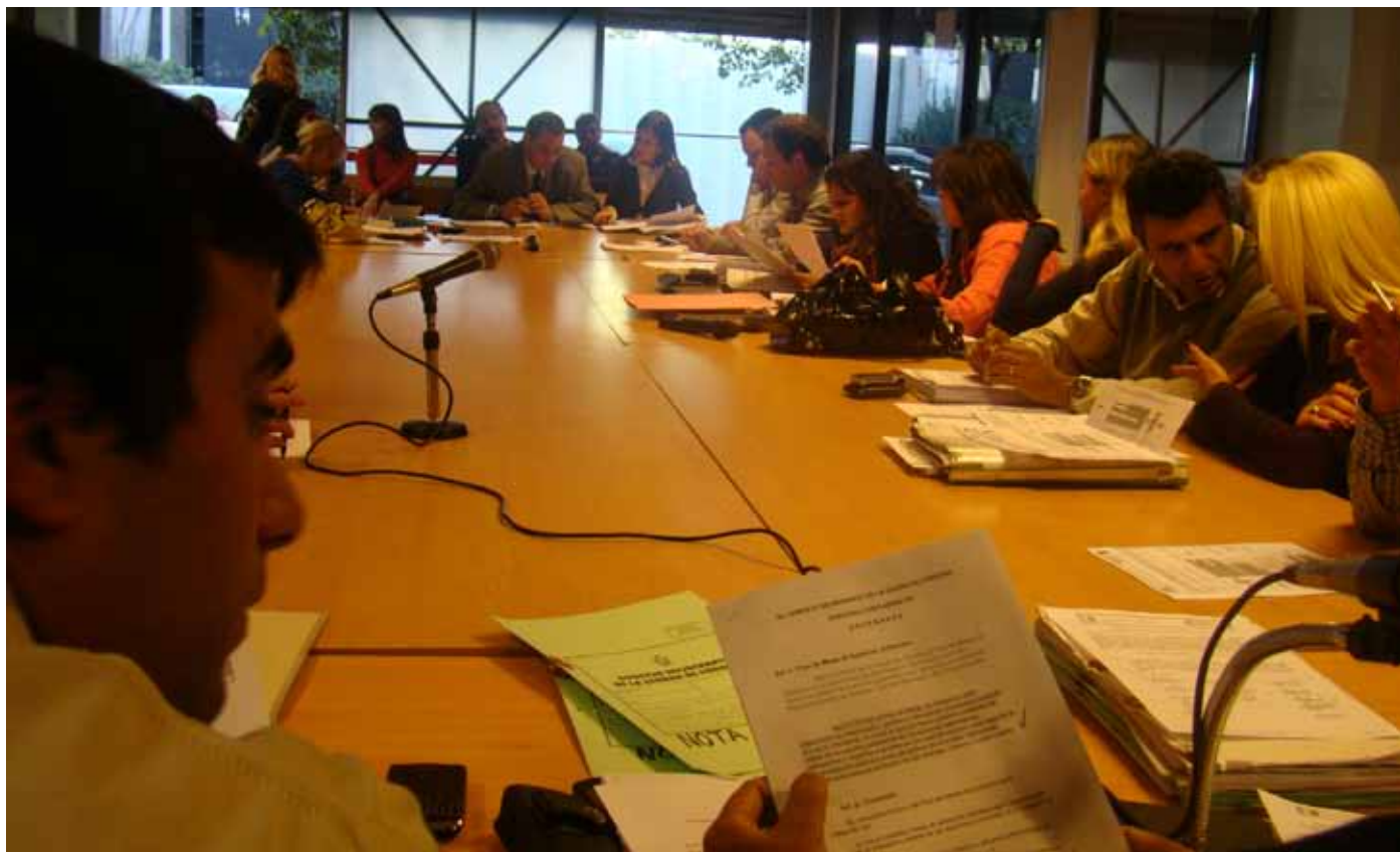
▲ La Comisión de Legislación General del Concejo Deliberante debate sobre el proyecto del Plan de Metas.

de noviembre, última reunión del año 2010, designar un asesor por bloque para que trabajaran junto con el relator de la Comisión en pos de elaborar un despacho común. Las principales diferencias entre los tres proyectos giraban en torno al plazo en el cual el intendente debía presentar el plan de metas a cumplir durante su gestión: 90 días en el proyecto de NC, 180 días en el la UCR, 60 días hábiles en el proyecto de UPC.