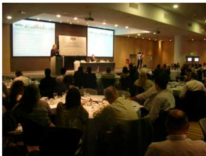
▲ Jornada con empresarios y políticos de la ciudad.

La red ciudadana Nuestra Córdoba cuenta entre sus miembros a las dos universidades más importantes de la provincia, la Universidad Nacional de Córdoba y la Universidad Católica de Córdoba. Este hecho cobra una notoria trascendencia en una ciudad donde la mayor