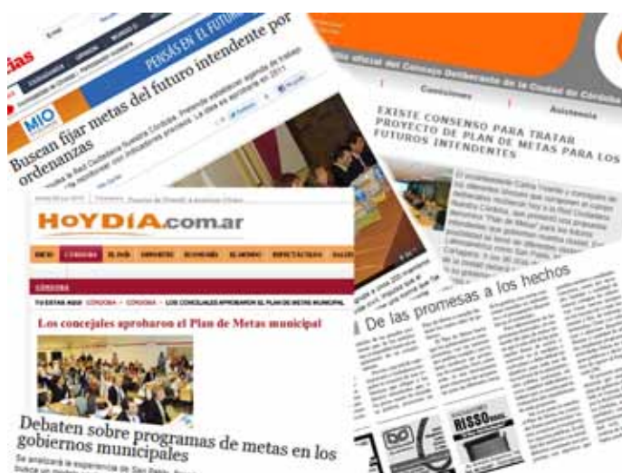
▲ Artículos de prensa sobre el debate del Plan de Metas.