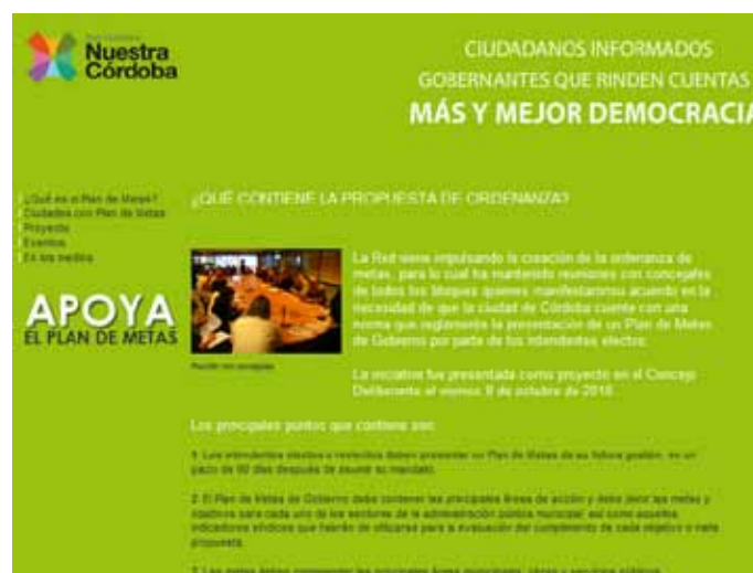
▲ Sección especial en el sitio Web de Nuestra Córdoba.

- Periódico Pueblo Yofre. “Plan de Metas. Por menos promesas y más cosas concretas”.