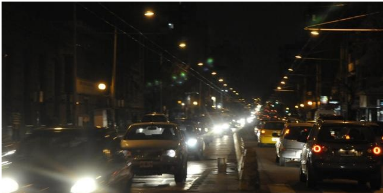
La menor participación. 39% de los viajes en el Centro se hace en auto, moto o taxi (Ramiro Pereyra/LaVoz).