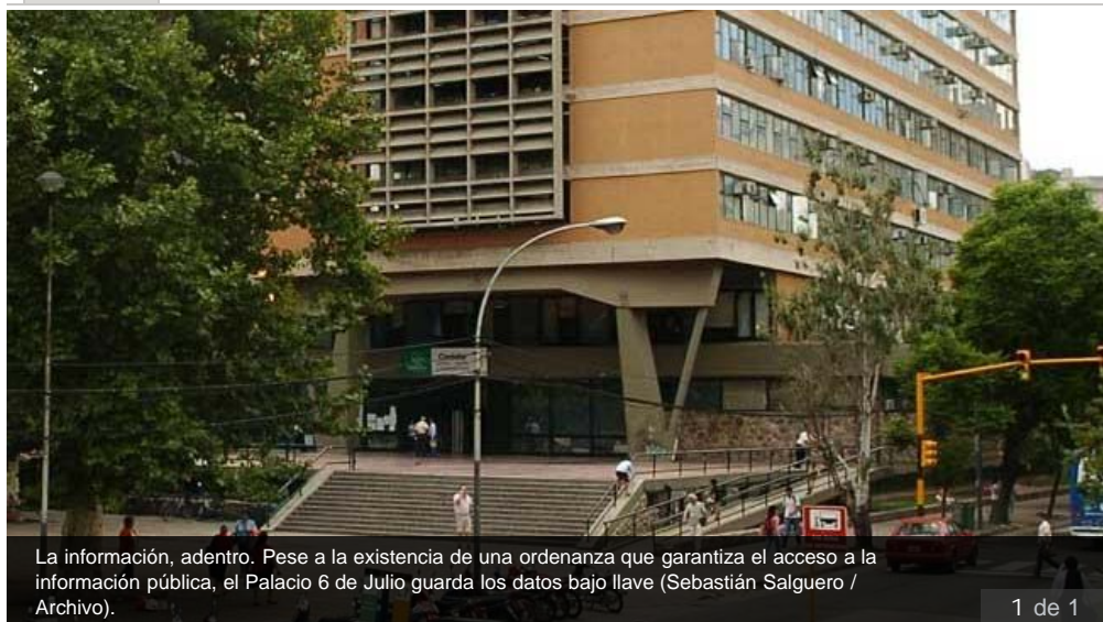
La información, adentro. Pese a la existencia de una ordenanza que garantiza el acceso a la información pública, el Palacio 6 de Julio guarda los datos bajo llave.